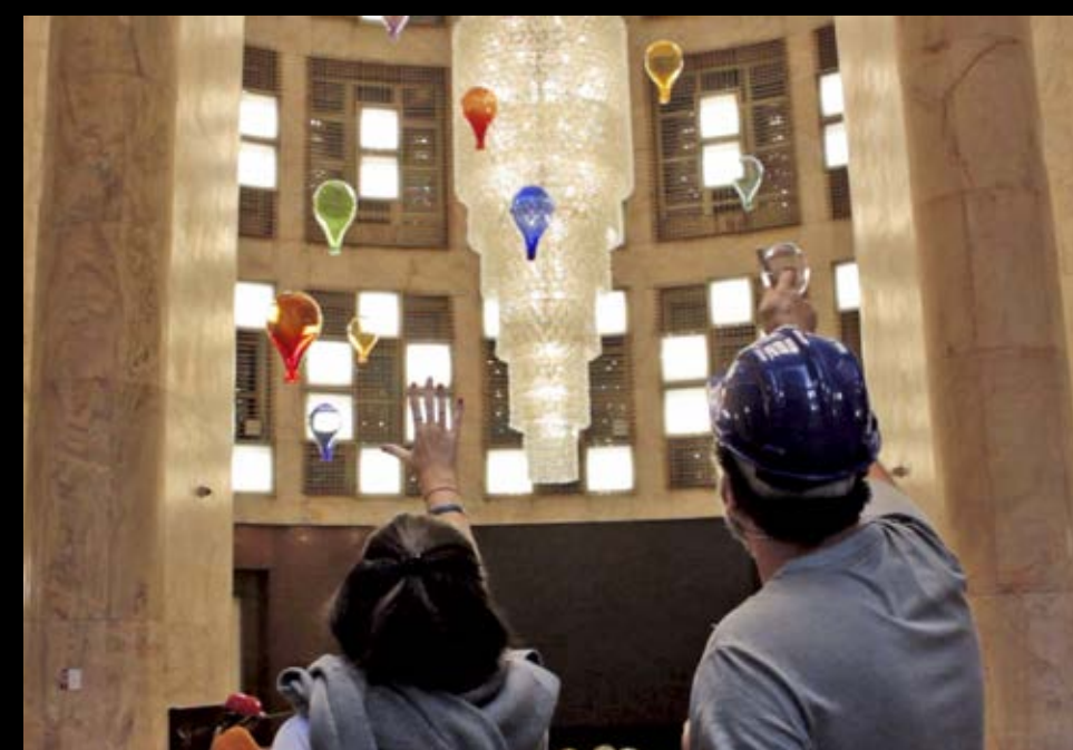
Montagem no Farol Santander, São Paulo, outubro de 2020 Assembly at Farol Santander, São Paulo, October 2020