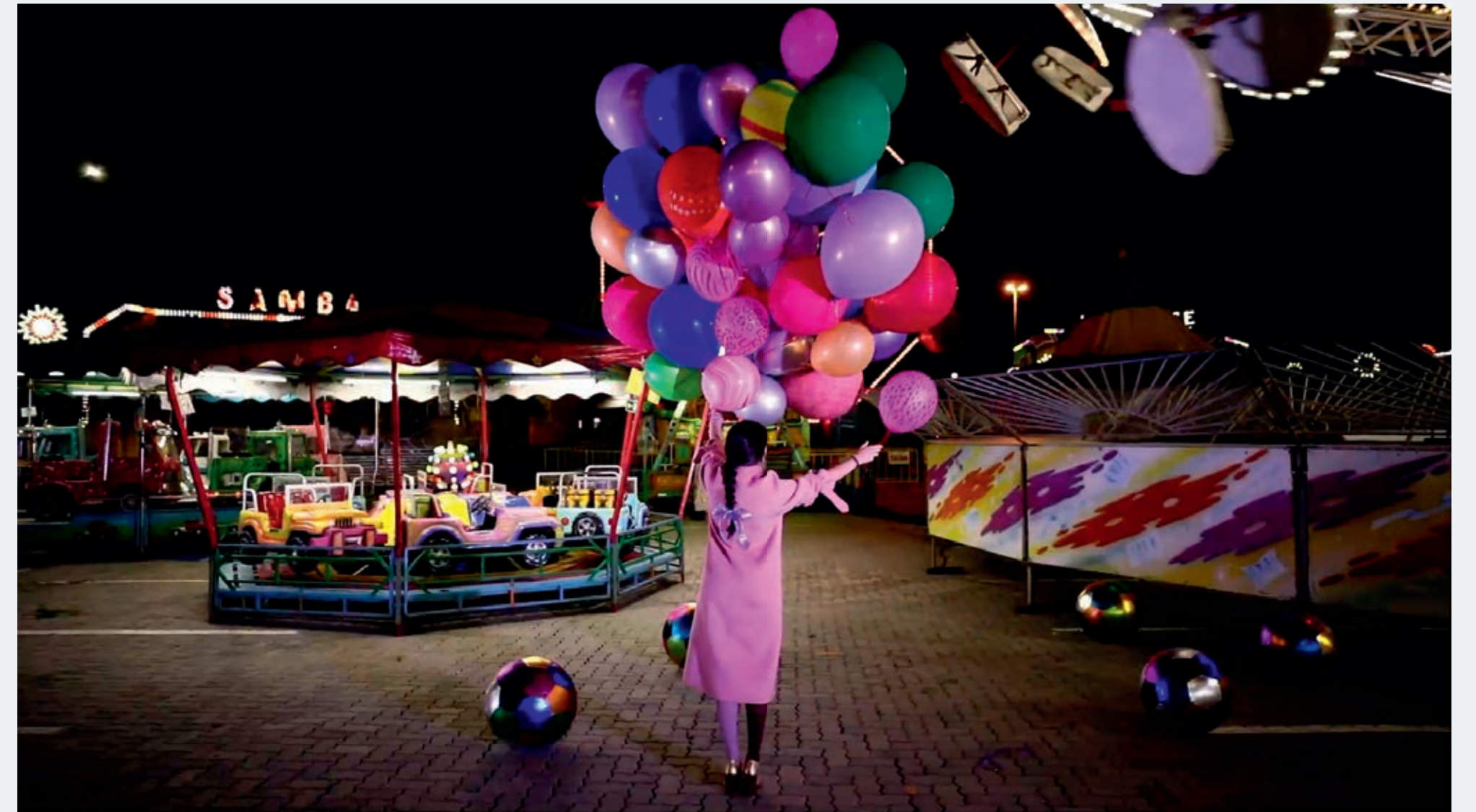
Levante, 2020 Video Video 8'