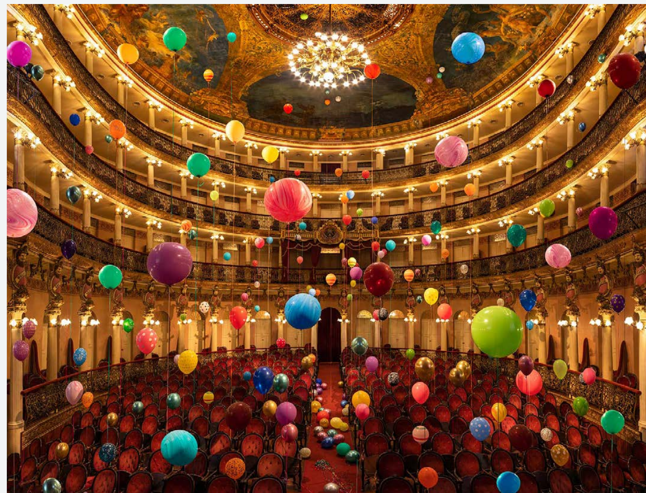
Theatro Amazonas/Palco, 1896 #1, 2019 Impressão digital com pigmentos minerais, 121,5 × 145,5 cm Digital printing with mineral pigments