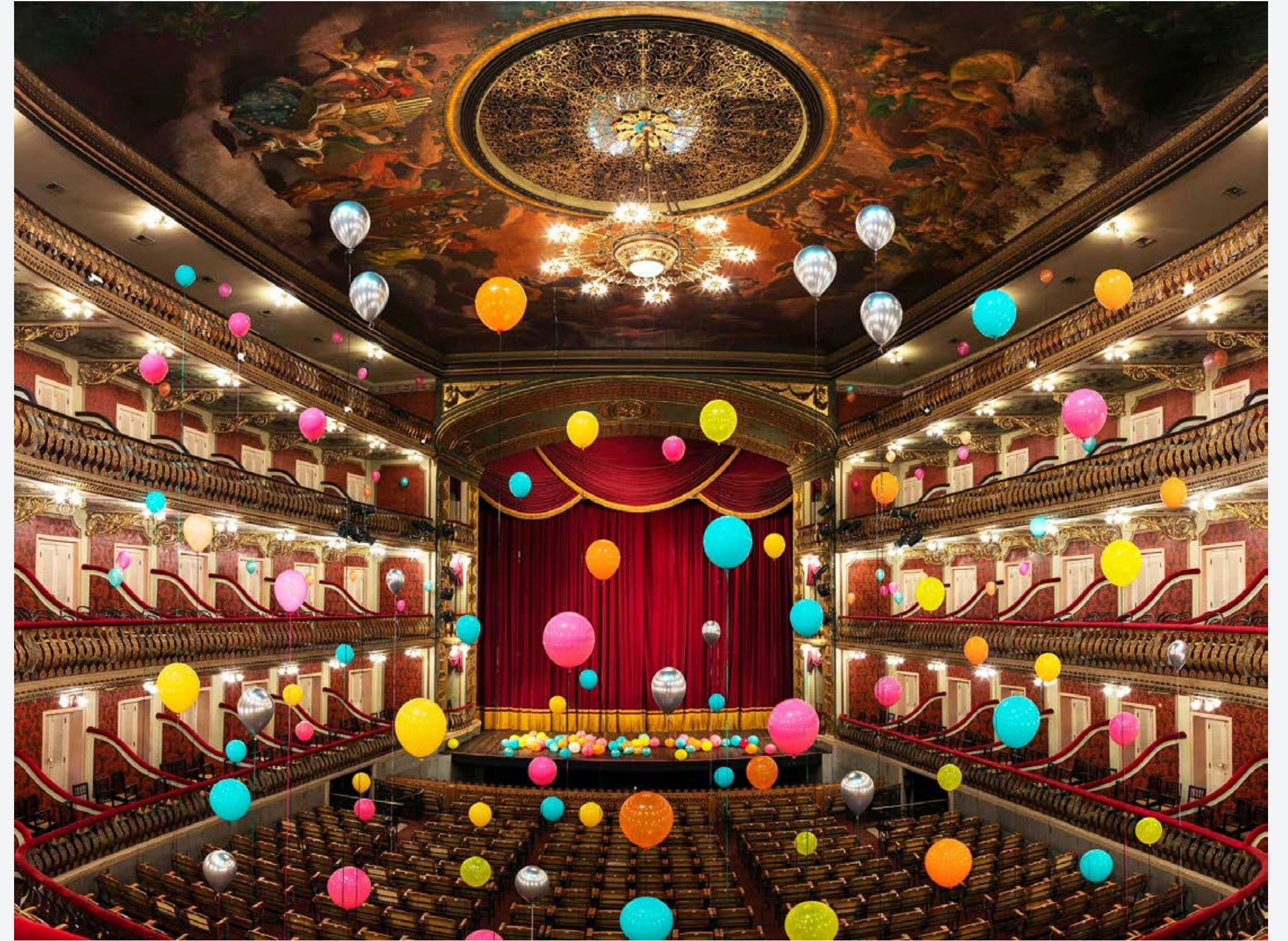
Theatro da Paz / Plateia, 1878 #2, 2019 Impressão digital com pigmentos minerais, 121,5 × 139,5 cm Digital printing with mineral pigments